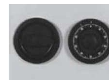
Artikel Nr. 35020 12mm vorstehend