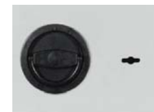
Grundausstattung 12mm vorstehend