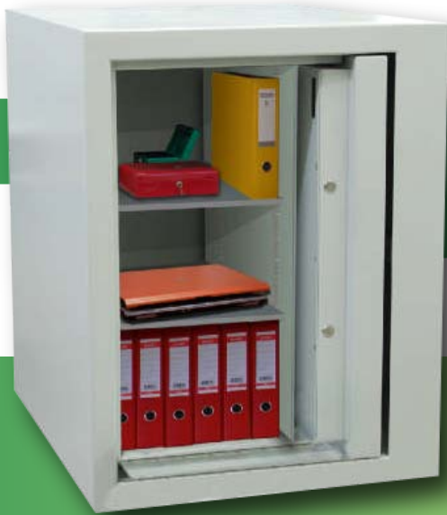
Modell: SlideProtect Pro 201