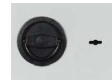
Grundausstattung 12mm vorstehend