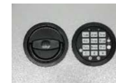
Artikel Nr. 41721 + 41722 12mm vorstehend