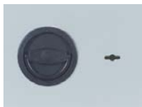
Klappgriff DB Standard