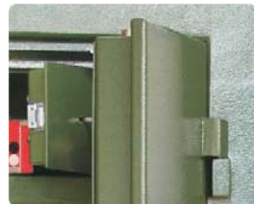
Extrastarke doppelwandige Tür

Versicherungsschutz bis ca. € 5.000,- (Unverbindliche Richtwerte, sprechen Sie mit Ihrer Versicherung)