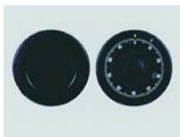
Mech. ZK Schloss Art. Nr.: 52520