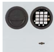
DFS Schloss mit 52534