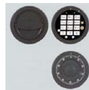
DFS Schloss mit 52535

Gewichts, Farb- und Maßangaben sind unverbindlich. Irrtum, Gewichts-, Maß- und Farbveränderungen vorbehalten. Geringe Gewichts-, Farb- und Maßabweichungen sind produktionsbedingt. Technische Änderungen vorbehalten. Tresore evtl. kopflastig, bei Inbetriebnahme entsprechende Sorgfalt gem. Einbauanleitung walten lassen.