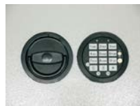
Abb. DFS Schloss Art. Nr.: 52521 Art. Nr.: 52522 Art. Nr.: 52533