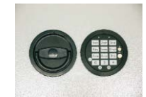
Art. Nr.: 36021 versenkt (flächenbündig)