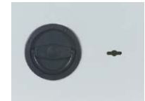
Klappgriff DB Kunststoff schwarz (Stand.) versenkt (flächenbündig)