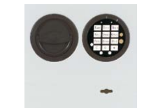
Art. Nr.: 36022+36025 versenkt (flächenbündig)