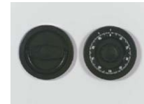
Art. Nr.: 36020 versenkt (flächenbündig)