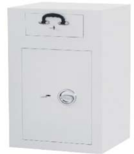
Größe 1 Klappgriff Metall gg. Mehrpreis