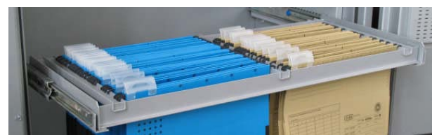
Art.-Nr. 39327 Hängeregistratur auszieh- bar auf Teleskop-schiene ab Art.-Nr. 39310, gg. Mehrpreis