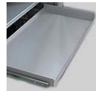
Art.-Nr. 39328 Fachboden ausziehbar auf Teleskop- schiene ab Art.-Nr. 39306, gegen Mehrpreis