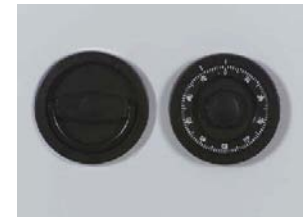
Art.-Nr. 39322 12mm vorstehend