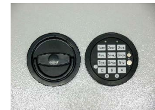
Art.-Nr. 39323 und 39324 12mm vorstehend