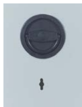
Klappgriff DB Standard