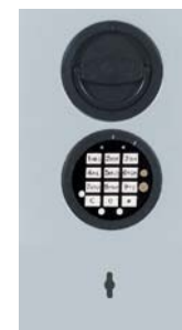
DFS Schloss mit mechanischer Revision