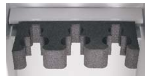
3 Waffenhalter 55mm Abstand