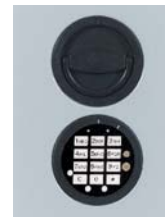
Abb. DFS Schloss