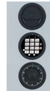
DFS Schloss mit mechanischer Revision