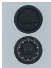
Mechanisches ZK Schloss