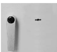
Hängegriff DB Metall standard