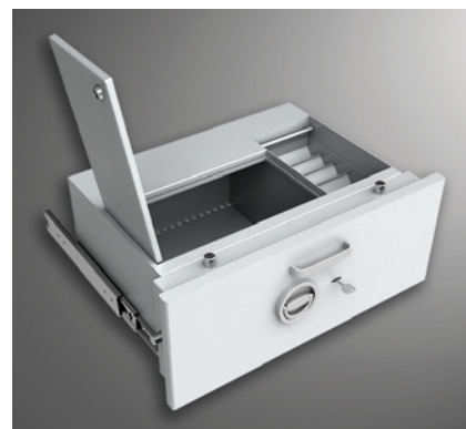
Sonderschublade mit Münzablagefach (Modelle D-204 und D-205)