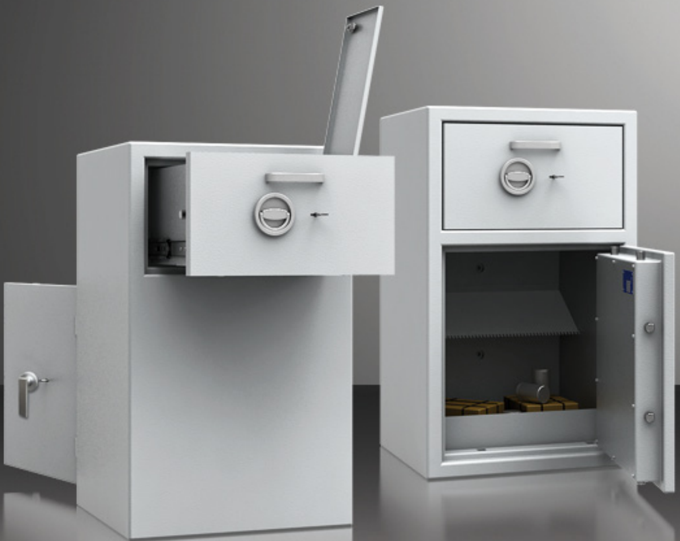
Abb. links: Rearload Deposit mit rückseitiger Einwurfschublade Abb. rechts: Frontload Deposit