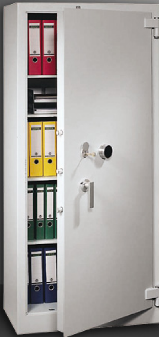
Abbildung: SG 1 VS, Größe 2, Ausführung A

Geprüft und zertifiziert nach den Richtlinien des Bundesamtes für Sicherheit in der Informationstechnik (BSI)