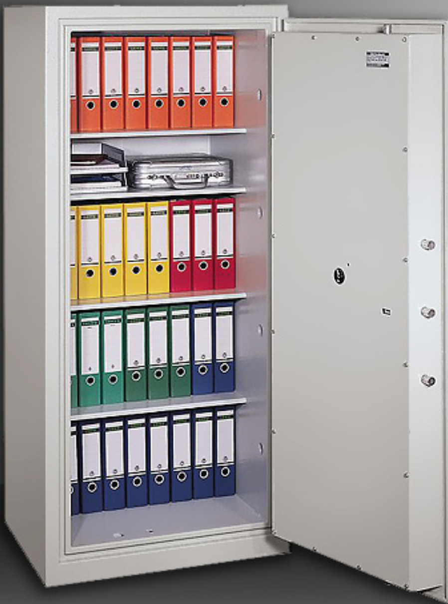
Abbildung: SG 2 VS, Größe 2, Ausführung A

Geprüft und zertifiziert nach den Richtlinien des Bundesamtes für Sicherheit in der Informationstechnik (BSI)