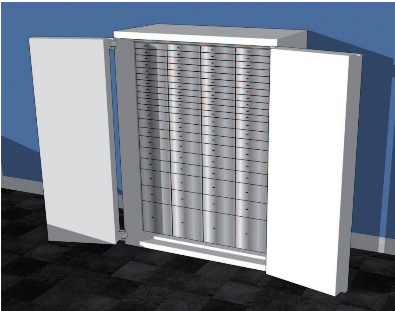
Abbildung: Konstruktionszeichnung einer Mietfachanlage in einem Wertschutzschrank