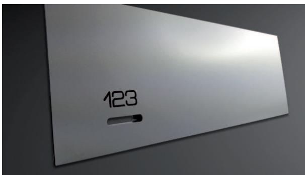
Aluminium natur, Fachnummern graviert